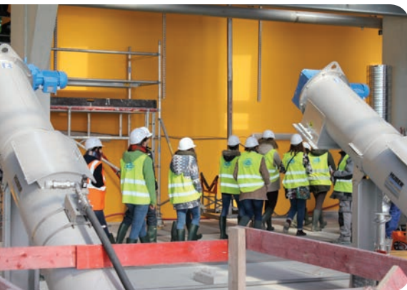
Voyage d'étude promotion Paris (2016).