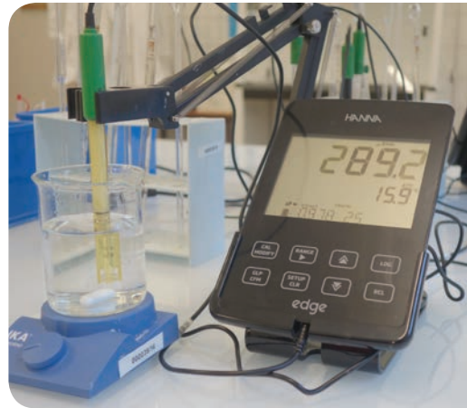
Appareil de mesures multiparamètres pour les Travaux Pratiques « eau de consommation/ eaux usées ».