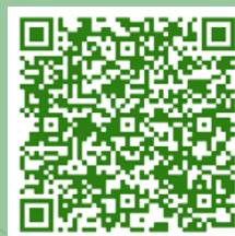
Mastère spécialisé GEDE

Le jury de recrutement est commun ENGEES, Mines Nancy.